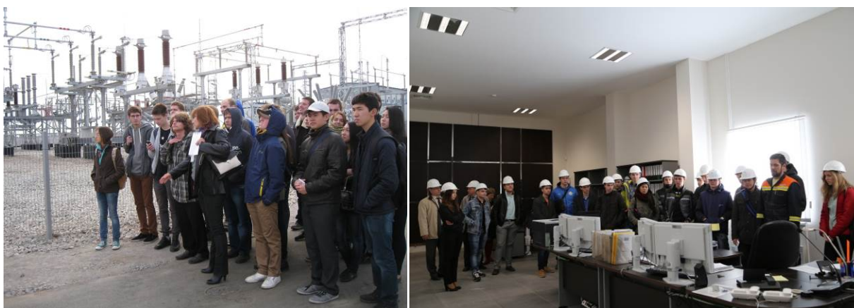
Рис. 5. Студенты прикладного бакалавриата на открытии учебного центра Ленэнерго (слева) и в диспетчерской подстанции Пулковская ОАО «ФСК ЕЭС» (справа)

В разработке и реализации ООП прикладного бакалавриата участвовали ведущие научные и производственные организации: ОАО «Концерн «НПО «Аврора» и ОАО НПО «Авангард». Концерн «НПО «Аврора» ; ЗАО «Светлана-Электронприбор», ООО «Научно-производственное предприятие «Цифровые радиотехнические системы»; Электросетевые компании входящие в холдинг ОАО «Россети»: ОАО «Ленэнерго», ОАО «МРСК Северо-Запада», Магистральные электрические сети Северо-Запада (МЭС Северо-Запада) - филиал ОАО «ФСК ЕЭС», Завод «Электросила», ООО «Силовые машины – Тошиба. Высоковольтные трансформаторы».