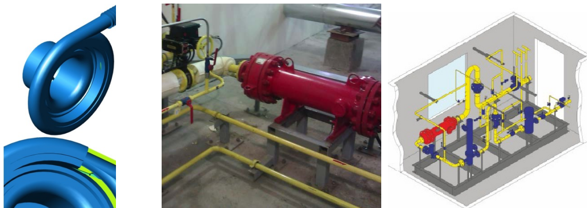
Рис. 3. 3D модель детандер-генератора TDG; Детандер-генератор MDG-20 на газораспределительной станции; 3D модель газораспределительной станции с детандер-генератором MDG-20

информации для ОАО «Карачевский завод «Электродеталь» на общую сумму 6,160 млн. руб. Координируются работы в соответствии с 4 заключенными в 2014 году договорами с ФГУП НИИ «Поиск». Общая стоимость работ составляет 3,297 млн. руб.