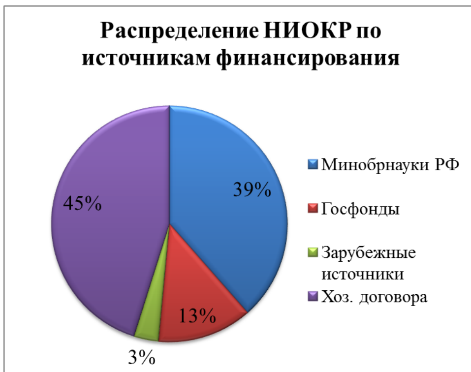
Рис. 4. НИОКР по источникам финансирования

С 1995 года издается журнал «Научно-технические ведомости СПбПУ», который с 2002 года входит в Перечень ВАК (редакция в соответствии с решением Президиума ВАК 6/6 от 19.02.2010 г.). В настоящее время журнал издается в пяти сериях: «Наука и образование», «Физико-математические науки», «Информатика. Телекоммуникации. Управление», «Экономические науки», «Гуманитарные и общественные науки». В 2014 году в журналах опубликовано 112 статей.