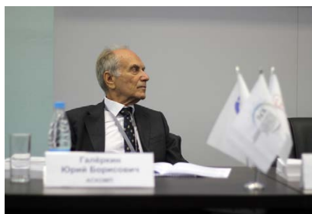
Рис. 1. Международная научно-техническая конференция по компрессоростроению